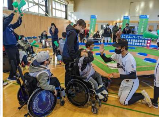
@堀江車輛電装株式会社