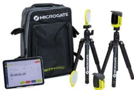
光電管 (走る速さを測る)