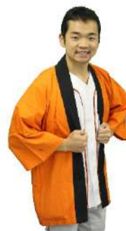
セカンドベルト無 var